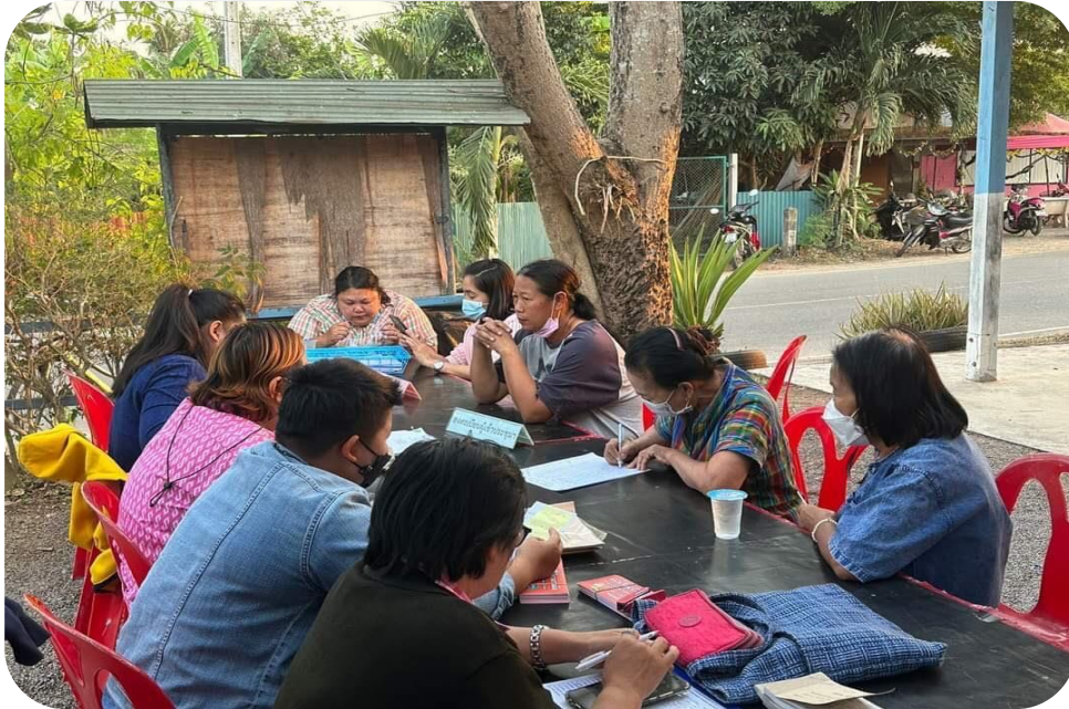
ก่อนการประชุม หมู่ที่ ๑๒

หมู่ที่ ๑๒ บ้านห้วยนา ตำบลคูบัว อำเภอเมืองราชบุรี จังหวัดราชบุรี วันอังคารที่ ๓๑ มกราคม ๒๕๖๖ ตั้งแต่เวลา ๑๗.๐๐ น. เป็นต้นไป สถานที่จัดประชุม ศาลาอเนกประสงค์ หมู่ที่ ๑๒